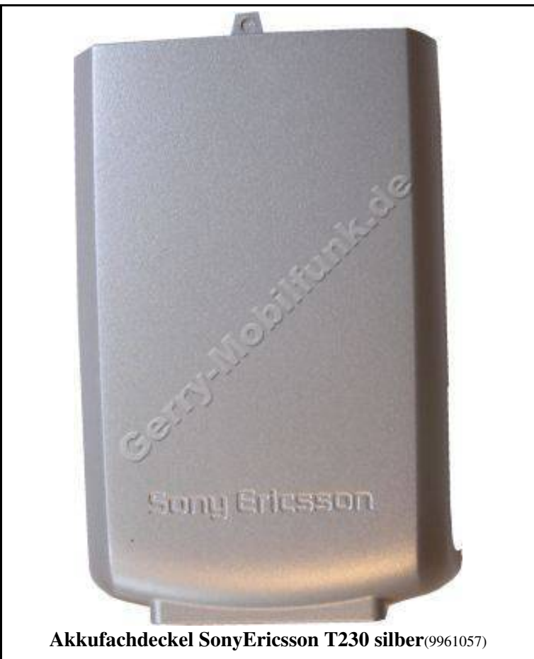
Akkufachdeckel SonyEricsson T230 silber(9961057)