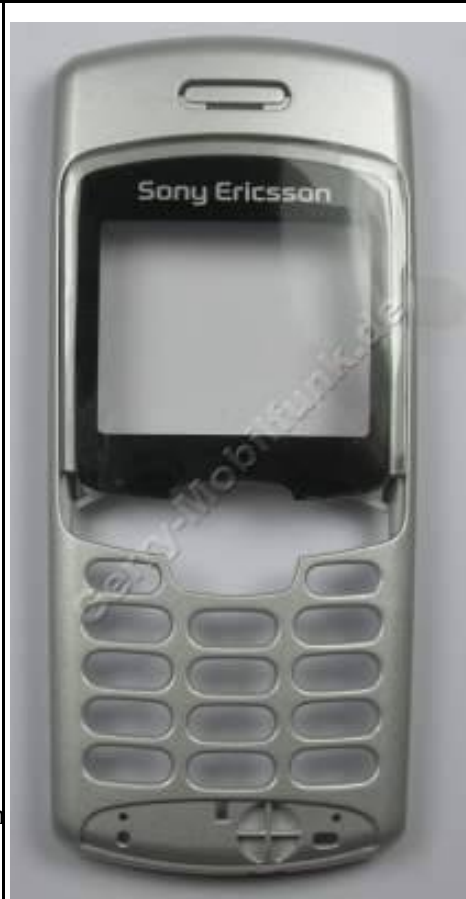
Oberschale SonyEricsson T230 Bladegrey grau original (9961059)

Preis : 17.90 € incl. MWST zzgl. Versandkosten per Vorkasse 2,99 € zur Shop-Seite