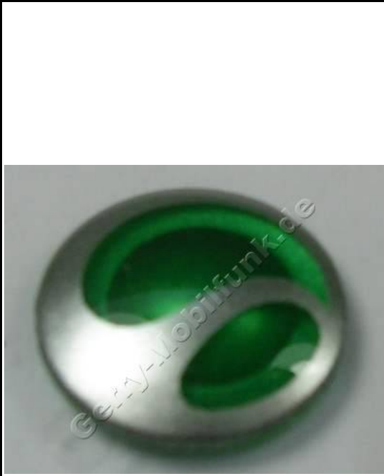
Logobadge Antennenabdeckung SonyEricsson T230 (9960170)