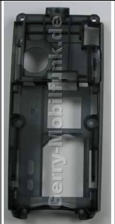
Gehäuseuserahmen Silber/Dunkegrau SonyEricsson T230 -Gehäuseträger (269201)

Preis : 17.90 € incl. MWST zzgl. Versandkosten per Vorkasse 2,99 € zur Shop-Seite