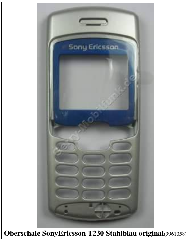
Oberschale SonyEricsson T230 Stahlblau original(9961058)

Preis : 8.90 € incl. MWST zzgl. Versandkosten per Vorkasse 2,99 € zur Shop-Seite